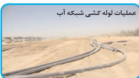
عملیات لوله کشی شبکه آب