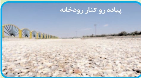
پیاده رو کنار رودخانه