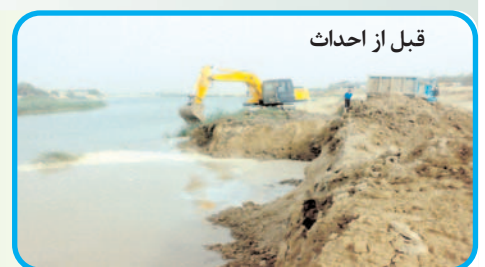
قبل از احداث